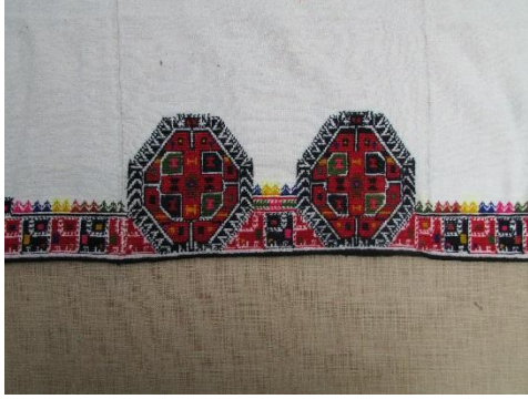
Долен околен дел од орнамент кукли со главен орнамент крстатни поли