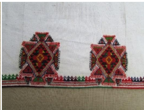
Долен околен дел од орнамент кукли со главен орнамент црното петле