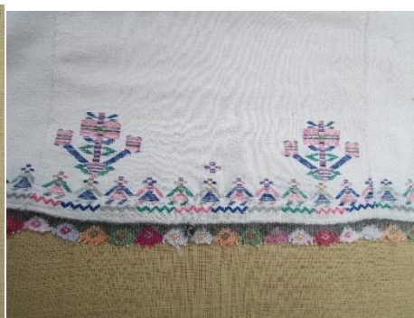
Орнамент момички , од долен околен дел на кошула, Радовишко Поле