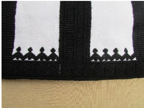
Орнамент куклици , Скопска Црна Гора