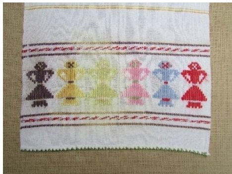
Орнамент девојчиња , на ткаена крпа бришалка , Овче Поле