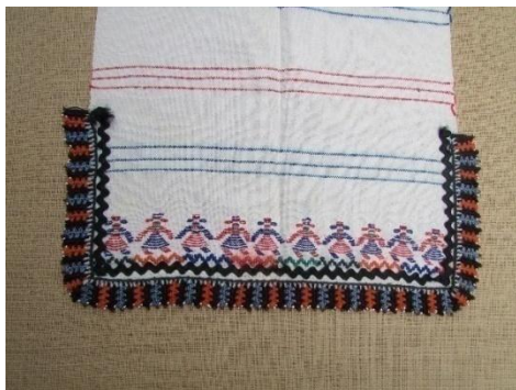
Орнамент момички од ткаена крпа, Радовишко Поле