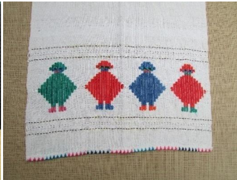
Орнамент девојчиња , на ткаена крпа бришалка , Овче Поле